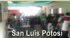
San Luis Potosí

LUGARES DE APOYO HUMANITARIO: la Casa del Migrante, San Juan Diego , ubicada en calle Cerrada de la Cruz No. 15, Col. Lechería, Tultitlán, Estado de México, Tel. (0155) 58845726; Casa San Carlos Borromeo , ubicada en 2da Privada de Moroleón No. 107, Col. Guanajuato, Salamanca, Gto. Tel. (01464) 648-4203; Casa de la Caridad Cristiana , ubicada en calle Escandón No. 203, Barrio San Juan de Guadalupe, San Luis Potosí, Tel. (01444) 815 62 25; lugares en los que te apoyarán con alimentación, podrás asearte, lavar tus pertenencias, sus servicios son gratuitos. Es tu decisión acercarte para pedir apoyo.